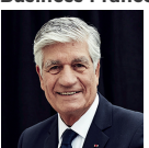
Maurice Lévy Président du Conseil de surveillance Publicis Groupe