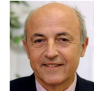
Jean-Hervé Lorenzi Président Cercle des Economistes