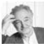
Jacques Attali Ecrivain, Futurologue et Président Fondation Positive Planet