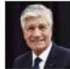
Maurice Lévy Président du Conseil de surveillance Publicis Groupe